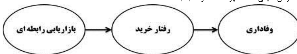
شکل ۱- مدل مفهومی پژوهش