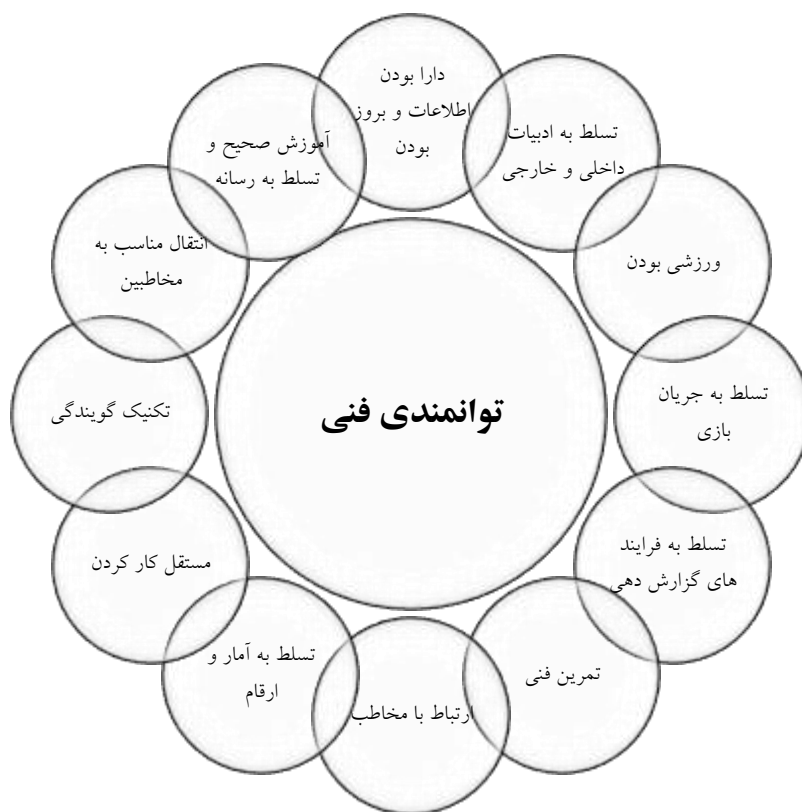
شکل ۲: کدگذاری انتخابی مرحله ی ۲- توانمندی های فنی