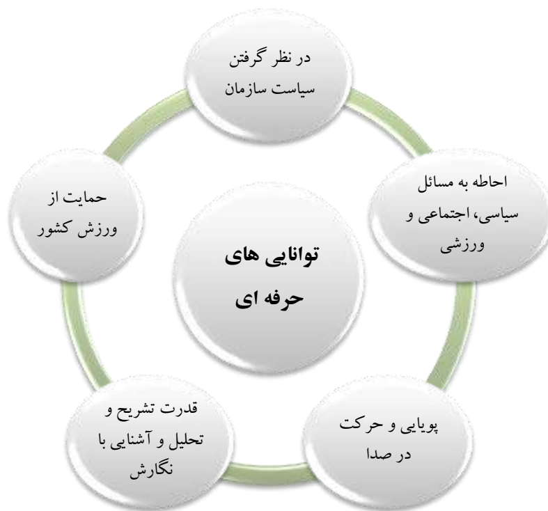
شکل ۳: کدگذاری انتخابی مرحله ی ۳- توانایی های حرفه ای