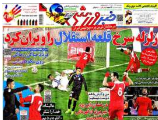
تصویر شماره (۶)

سازی کنشگران اجتماعی (زلزله سرخ، قلعه استقلال) پرداخته است تا قدرت تخریب یک کنشگر بر روی کنشگر دیگر آشکار شود. تصاویر لحظه به ثمر رسیدن گل تیم قرمز پوش را نشان می‌دهد که همچون آواری بر روی سر تیم حریف همچون قلعه ویران خراب شده است.