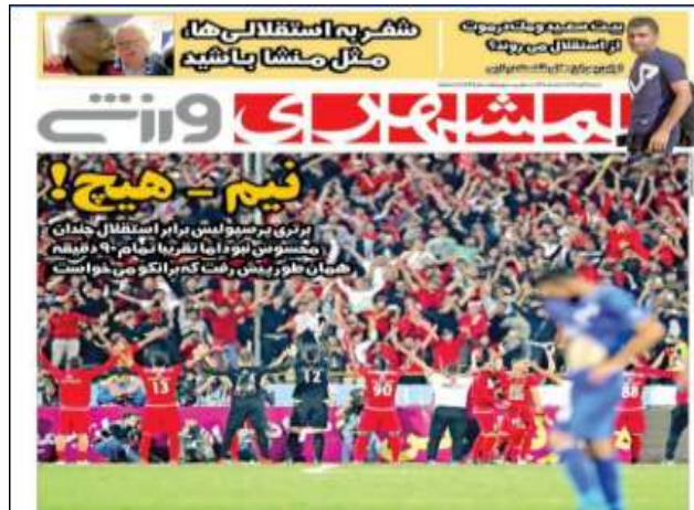
تصویر شماره (۱۲)

تیتراها با کمرنگ سازی در جذب مخاطب و تشویق آن‌ها به خرید روزنامه موردنظر نقش مهمی را بازی می‌کند. در بسیاری از این تیتراها می‌توان تشخیص بخشی با استفاده از نام‌دهی غیررسمی را مشاهده نمود. در بعضی موارد ارزش‌دهی‌ها می‌تواند با توجه به جبهه‌گیری و تعصب ورزشی نویسان آن روزنامه خاص مثبت یا منفی باشند. سیاست و چارچوب این عناوین گاهی به‌صورت مغرضانه و در جهت اهداف شخصی و یا تحریک قشر طرفدار موردنظر با به‌کارگیری نسبت‌دهی و نام‌دهی‌های خاص به افراد معروف این دو تیم همیشه رقیب و نامدار پیش می‌رود.