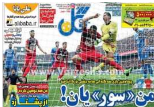
تصویر شماره (۹)

اجتماعی شادی و سرور مربی تیم آبی‌پوش در مقابل تیم صدرنشین قرمز پوش و برتر میدان از لحاظ درصد مالکیت و بازی هجومی است. در تصویر، جنگ قدرت تا مدخل دروازه برای فتح آن ادامه دارد. تیتر فرعی به کنشگر فعال یعنی تیم آبی‌پوش (آبی‌ها) در سه گله کردن چهارمین تیم که پراهمیت‌ترین حریف آن‌ها محسوب می‌شود اشاره می‌کند و برای آن‌ها جشنی بزرگ است.