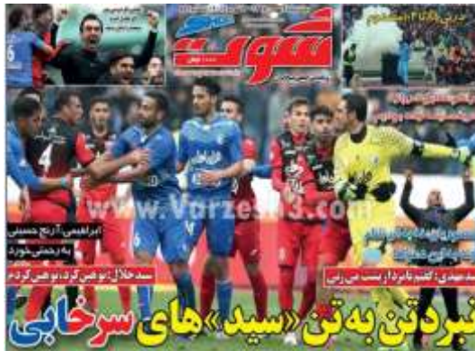
تصویر شماره (۸)