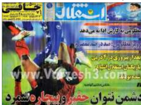
تصویر شماره (۷)

قرمز (ارزش دهی منفی) به تیم مقابل، به تیم محبوب خود (کنشگر محذوف) هشدار داده است. تصویر بیان گر قدرت تیم آبی پوش در لگدمال کردن بازیکن تیم پرسپولیس و انتقال حس حقارت به آن‌ها است.