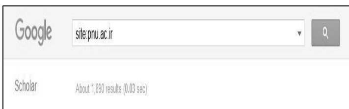
شکل ۴. نمونه‌ای از اندازه‌گیری شاخص‌های جستجوگر علمی گوگل

ج- تعداد فایل‌های غنی اطلاعات با وزن ۱۵٪: تعداد فایل‌های ادوب آکروبات (pdf)، ورد (doc)، پاورپوینت (ppt) و فایل‌های ادوب پست اسکریپت (ps) را شامل می‌شود که تمامی این فایل‌ها از طریق مرورگر گوگل استخراج می‌شود.