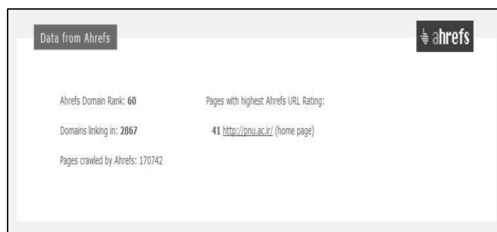
شکل ۲. نمونه‌ای از اندازه‌گیری مجزا بررسی اندازه و حجم وبسایت

دانشگاه‌ها نیز در گذر از دنیای فیزیکی به دنیای مجازی، ناگزیر به طراحی وبسایتی برای عرضه فعالیت‌ها و خدمات خویش، به ویژه اطلاع‌رسانی مفید و ارزشمند در محیط وب به کاربران پرداخته‌اند. اکنون به طور تقریبی، تمامی دانشگاه‌های زیر پوشش وزارت علوم، تحقیقات و فناوری دارای وبسایت هستند، اما میزان اثربخشی هر یک از این وبسایت‌ها اعم از