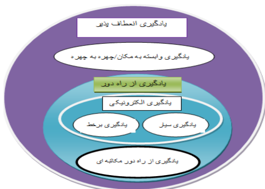
شکل ۱. یادگیری سیار و جایگاه آن در یادگیری از راه دور (براون، ۲۰۰۳)

به عبارت دیگر، یادگیری الکترونیکی و یادگیری سیار به عنوان زیرمجموعه‌ای از آموزش از راه دور محسوب می‌شوند. همان طور که در شکل ۲ مشاهده می‌شود، در طی قرون مختلف، شیوه انتقال آموزش از راه دور دچار تغییر و تحولاتی شده که این تحولات ناشی از پیشرفت در فناوری‌های مختلف بوده است.