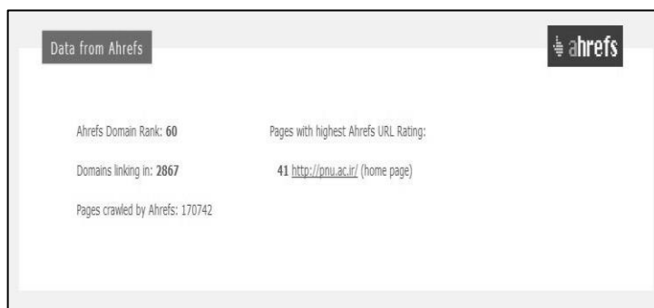
شکل ۲. نمونه ای از اندازه‌گیری مجزا بررسی اندازه و حجم وبسایت

دانشگاه‌ها نیز در گذر از دنیای فیزیکی به دنیای مجازی، ناگزیر به طراحی وبسایتی برای عرضه فعالیت‌ها و خدمات خویش، به ویژه اطلاع‌رسانی مفید و ارزشمند در محیط وب به کاربران پرداخته‌اند. اکنون به طور تقریبی، تمامی دانشگاه‌های زیر پوشش وزارت علوم، تحقیقات و فناوری دارای وبسایت هستند، اما میزان اثربخشی هر یک از این وبسایت‌ها اعم از